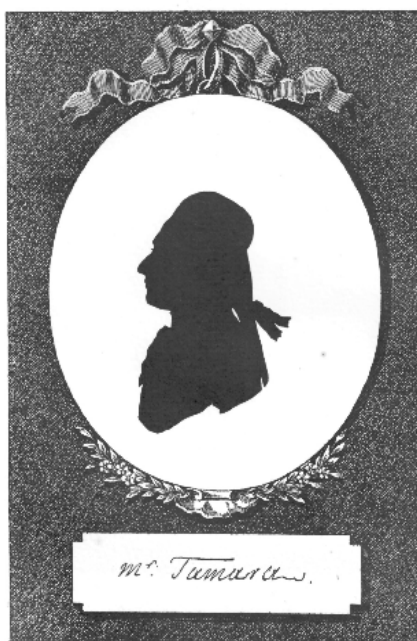
Рис. 1. Гравюра. Василий Степанович Тамара (Томара). Цинкография. Санкт-Петербург, 1899 г. [Двор императрицы 1899, т. 2, л. СХІХ]. Собрание Г.Н. Андреевой. Москва. Скан сделан автором статьи.

поразительного сходства с портретируемым» [Лазаренко, 2020]. Портреты по инициативе герцога Георга Георгиевича Мекленбург-Стрелицкого, правнука императора Павла I, были обнародованы через 100 лет в виде роскошно изданного двухтомного издания [Двор императрицы 1899, т. 1–2]. В настоящее время это издание в целом и отдельные гравюры из него являются культурным артефактом и предметом коллекционирования, а также одним из важных источников информации об окружении Екатерины II.