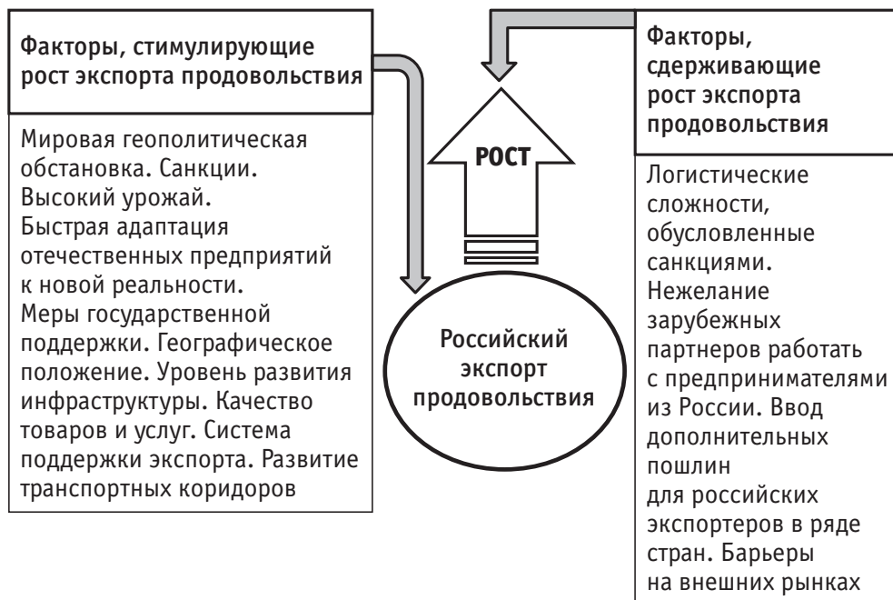
Рис. 1. Факторы роста российского экспорта продовольствия