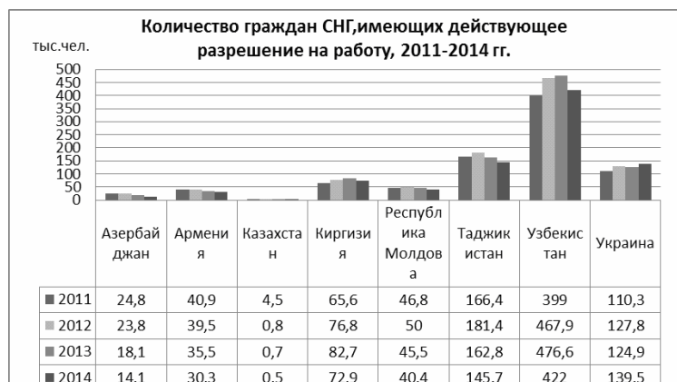
Рис. 4 [5, с. 176].

Доля граждан ЕС в общем количестве трудовых иммигрантов в этот период сократилась с 1,23 до 1%; количество граждан США – также сократилось с 0,16 до 0,1%. Среди стран дальнего зарубежья лидирующие позиции занимает Китай – около 7% на всем протяжении рассматриваемого периода; Турция (рост с 1,8 до 2,3%); КНДР (рост с 1,9 до 3%) [5, с. 176].