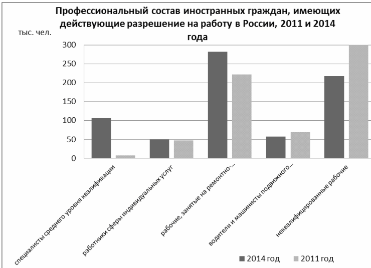
Рис. 6 [5, с. 179].

Однако имеется и несколько исключений. Так, среди иностранных граждан из Китая и КНДР, имеющих разрешение на работу в России, около 40% приходится на возрастную группу 40–49 лет. А для граждан из Турции, имеющих разрешение на работу в России, наибольшее значение приходится на возрастную группу 30–39 лет – около 30%.