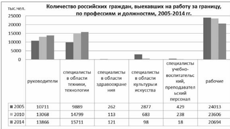
Рис. 2 [5, с. 187].

Таким образом, можно заключить, что в последнее десятилетие меняется структура трудовой эмиграции из России: на фоне общего снижения численности трудовых мигрантов происходит рост мигрантов старших возрастных групп. По-видимому, это связано с изменениями в российской экономике, в результате которых лица предпенсионного возраста оказываются невостребованными на рынке труда.