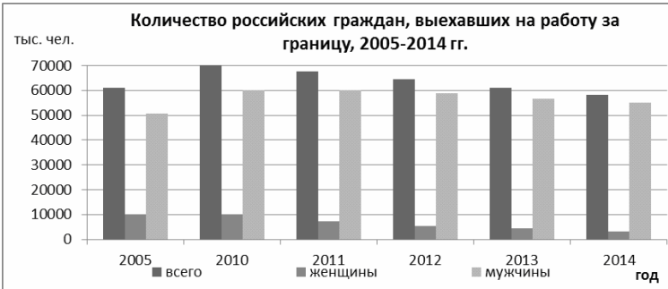
Рис. 1. [5, с. 186].

Таким образом, можно заключить, что в последнее десятилетие меняется структура трудовой эмиграции из России: на фоне общего снижения численности трудовых мигрантов происходит рост мигрантов старших возрастных групп. По-видимому, это связано с изменениями в российской экономике, в результате которых лица предпенсионного возраста оказываются невостребованными на рынке труда.