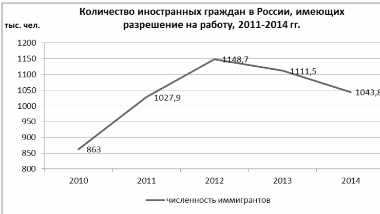
Рис. 3 [5, с. 176].

А кто же приезжает в Россию с целью трудоустройства? Социально-демографический портрет трудовых иммигрантов будет иным.